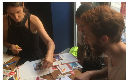
Atelier à Toulouse

Pour réaliser cette gazette, nous avons organisé des ateliers à Lille, Strasbourg, Nantes, Paris, Marseille, Bordeaux, Lyon et Toulouse afin de récolter la parole des habitants, avec et sans domicile, des réseaux La Cloche. Merci à tous nos contributeurs ! Un grand merci aussi à Usbek & Rica grâce à qui nous publions cette gazette.