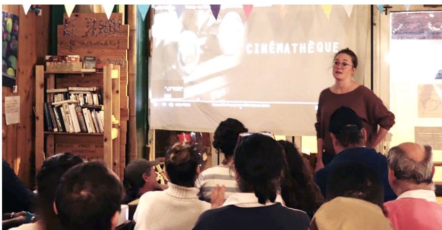
Atelier à la Cinémathèque